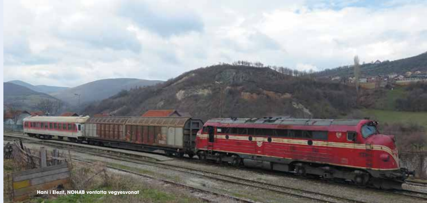
Hani i Elezit, NOHAB vontatta vegyesvonat

Az észak-koszovói, szerb lakosságú vidék Belgráddhoz való szoros kötődését jól érzékelteti az itt futó vasútvonal sajátos működése, hisz a Kraljevo – Kosovska Mitrovica viszonylaton közlekedő napi két pár „belföldi” vonatot és a leposavići betétjáratot a Szerb Vasút (ŽS) üzemelteti. Annak ellenére, hogy az egyébként modern szerb motorvonatok több, mint 50 km-en át koszovói területen haladnak, a szerelvényeken a ŽS személyzete teljesít szolgálatot, az állomásnevek szerb nyelven, többségükben cirill betűkkel vannak kiírva, a ŽS díjszabása alapján megváltott menetjegyet pedig dinárral kell kifizetni.