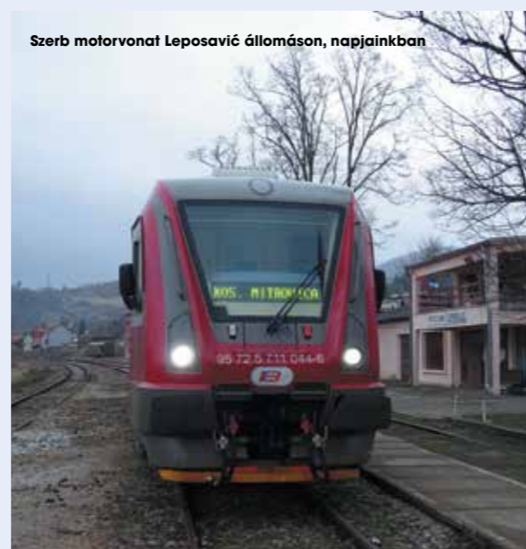
Szerb motorvonat Leposavić állomáson, napjainkban

1999 és 2001 között igen fontos stratégiai szerephez jutott a vasút, a KFOR keretein belül pedig Olaszországból, Németországból, Franciaországból, Svédországból és Norvégiából is érkeztek