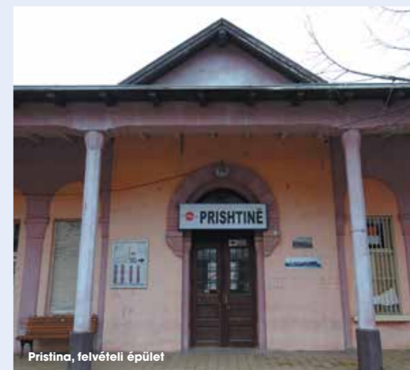
Pristina, felvételi épület

A Szaloniki – Szkopje – Belgrád útvonalon egész évben közlekedő Hellász Expressznek hála, a koszovói és a macedón fővárosok összekötésével akár egy kisebb balkáni körút is tehető, azt azonban figyelembe kell venni, hogy amennyiben Koszovóba nem Szerbia felől, hanem egy harmadik országból történik a belépés, Szerbia felé nem hagyható el az ország, a szerb