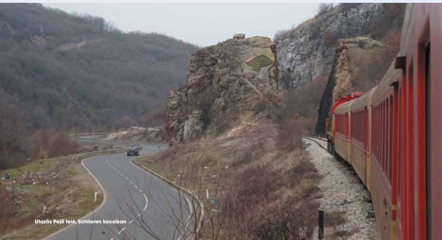
Utazás Pejë felé, Schlieren kocsiban

A vonatok bár kényelmesek, téli időszakban megfelelően fel kell öltözni, előfordulhat ugyanis, hogy a kocsik nem megfelelően fűtöttek, nyári időszakban azonban a nyitott ablak melletti NOHAB-duruzsolás csak fokozza a koszovói táj különleges hangulatát. Menetjegyek az állomásokon, és a vonatokon is válthatók, és ezek a legnagyobb távolságra sem kerülnek többé 3 eurónál. Az egyszerű, barátságos megnyilvánulás és a vendégszeretet egyébként nemcsak a vasúti dolgozókat, hanem az ország teljes lakosságát is méltán jellemzi, különösen a fővárost, illetve Pejë és Prizren környékét, ahol az egyedi élményeket előtérbe helyező alternatív turizmus egyre inkább felértékelődni látszik.