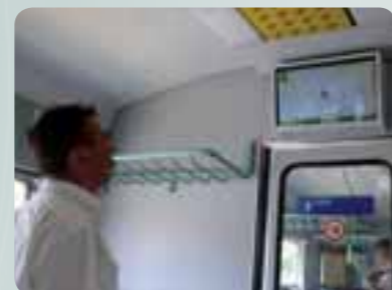
Az utasok szívesen nézik a tájékoztató monitorokat