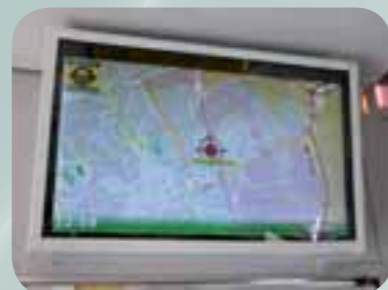
Helymeghatározás, sebesség, állomások – működésben a saját fejlesztésű utastájékoztató

„A fejlesztésünk lényege, hogy a számítógép a GPS-koordináták, az aktuális idő, valamint az internetről kapott adatok alapján másodpercre pontosan képes közölni az utazóközönség számára értékes információkat” – mondta