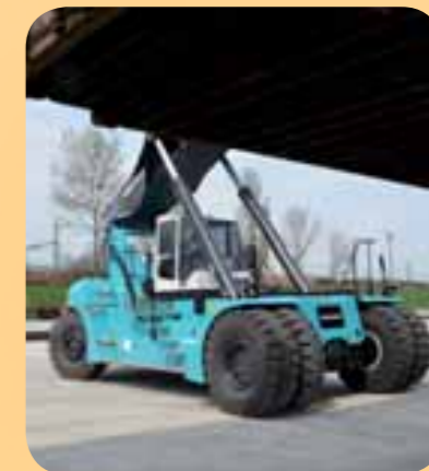
Az új munkagép 5 konténert is egymásra tud tenni

„A GYSEV CARGO Zrt-nek nem csupán az áru fuvarozásban, hanem az ahhoz kapcsolódó logisztikai szolgáltatások területén is magas színvonalon kell teljesítenie. Ebben segít minket ez az új, nagyteljesítményű munkagép, amely már a projekt keretében megnövelt tárolókapacitásunk kiszolgálására is képes