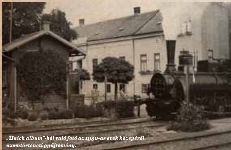
„Haich album”-ból való fotó az 1930-as évek közepéről. Üzemtörténeti gyűjtemény.

Izgalmas jelenetnek voltak tanúi, akik f. hó 5-én d.u. 6 óra tájban a Deák térről az alsó löverekbe vezető úton sétáltak. N.Czenk felől egy tehervonat közeledvén, a vasúti átjárónál a sorompók szokás szerint leeresztettek, azonban az egyik nem a helyére, a fülesbe szállott bele, hanem le egészen a földre. Csakhamar egy üres szekér nyargalt arra, s a kocsis nem bírván a lovakat feltartóztatni, azok átugrottak a földön fekvő sorompón, amelyet el is törtek. A túlsó sorompó jól volt leeresztve, s így a szekér nem mehetvén tovább, a lovak a sínek között állottak, míg a tehervonat alig 50 ölnyire volt már. A megijedt kocsis nem tudott magán segíteni, a sétálók közül többen tehát az őrháznál lévő őrnek integettek kendőikkel annak jeléül, hogy a sorompót emelje fel. Szerencsére ez el értette az integetést, a sorompó felemelkedett s a lovak és a kocsis a legválságosabb pillanatban megmenekültek az elgázoltatástól.”