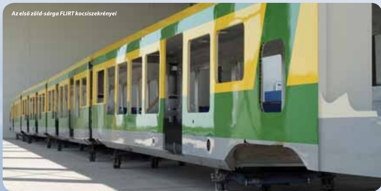
Az első zöld-sárga FLIRT kocsiszekerényei

Elkészült az első GYSEV FLIRT motorvonat négy kocsiszekerénye a Stadler szolnoki gyárában. A négyrészes motorvonat összeszerelését ezután a Stadler Rail Csoport lengyelországi üzemében végzik el. A motorvonat annak a flottának az első járműve, amelyről a GYSEV és a Stadler 2012 áprilisában írt alá szállítási szerződést.