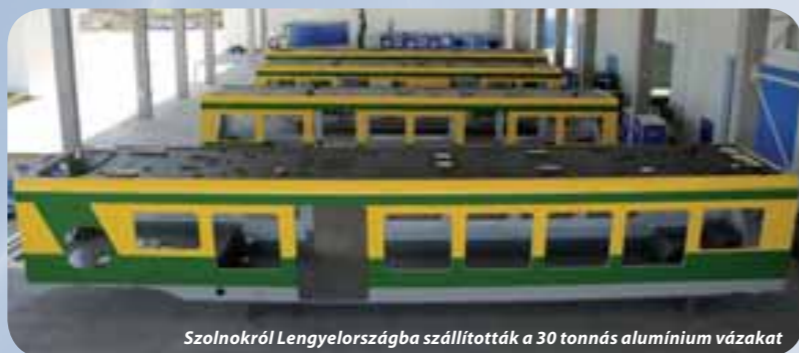
Szolnokról Lengyelországba szállították a 30 tonnás alumínium vázokat