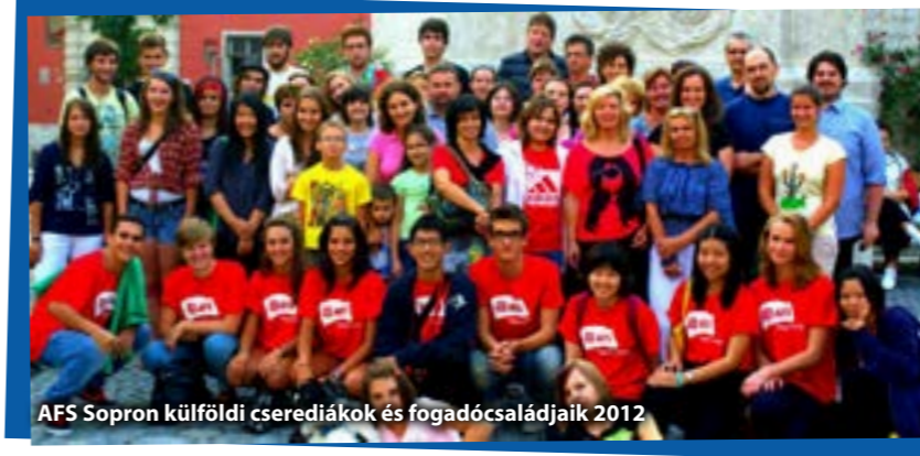
AFS Sopron külföldi cserediákok és fogadócsaládjaik 2012

tagjaként részt vehet mindennapi életükben; akik megosztják vele örömeiket, gondolataikat, véleményüket, hagyományait és ugyanezt várják tőle is. Ez természetesen nyitottságot, érdeklődést, alkalmazkodóképességet igényel.