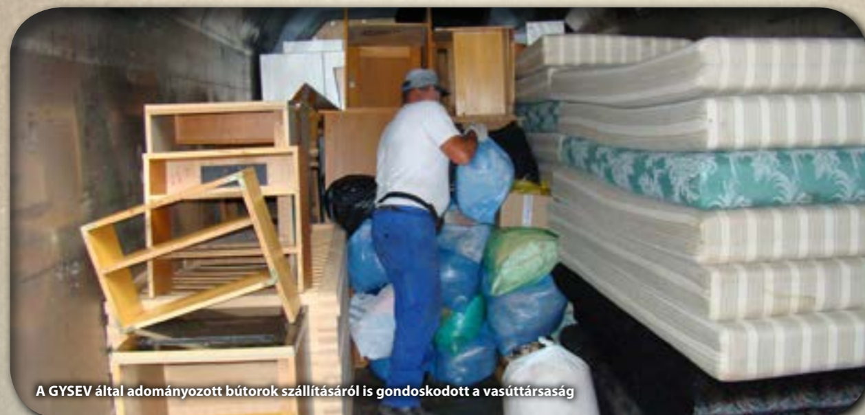
A GYSEV által adományozott bútorok szállításáról is gondoskodott a vasúttársaság

A GYSEV Zrt. is csatlakozott a dévai gyermekek megsegítéséért indított soproni összefogáshoz. A vasúttársaság egymillió forint értékű használt bútort ajánlott fel a Határok Nélkül Alapítvány felhívására. A cég a bútorok elszállításáról is gondoskodott.