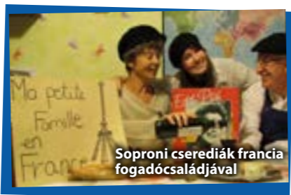
Soproni cserediákok francia fogadócsaládjával

22 év alatt az AFS Magyarország szervezésében közel 1500 diák tanulhatta meg, hogy létezik másfajta életvitel, a miénktől eltérő kultúra, amelyet érdemes megismerni. Az AFS bátorította őket, hogy legyenek nyitottak az új eszmék befogadására, lássák meg, miből adódnak a kulturális különbségek, melyek az igazi értékek, miben rejlik az emberi méltóság, amely egyesíti a világ népeit.