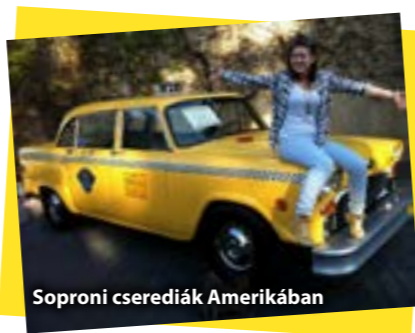
Soproni cserediákok Amerikában

Családok fogadták, és fogadják be diákjainkat olyan távoli országokban, mint Thaiföld, Dél-Amerikai országok, Dánia szigetei, Észak-Amerika államai és Európa városai vagy kis települései. Az AFS diákok csodálatos helyeket ismernek meg, anyanyelvi közegben tanulnak különféle nyelveket, és tapasztalataik visszahatnak itthoni környezetükre is.