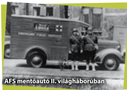
AFS mentőautó II. világháborúban

Az AFS alapítóinak volt egy ötletük, melynek szépsége az egyszerűségében rejlett: ha a jövő generációja együtt tud érezni más nemzetekkel, megérti a világ kultúráinak sokszínűségét, felismeri, és elfogadja a különbségeket, akkor talán a háborúk is elkerülhetőek lesznek.