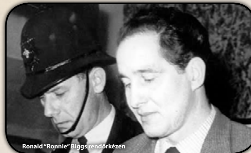
Ronald "Ronnie" Biggs rendőrkezen

1914 februárjában borzalmas tettet vitt végbe egy fosztogató banda, akiknek kilétére a mai napig nem derült fény. Egy észak-amerikai