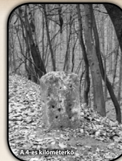
A 4-es kilométerkő

szállítás okozta. Az üzem a forgalmi utaktól messze volt, illetve jelentős volt előbbi kettő között a szintkülönbség. Egész Európa felfigyelt a Bécsújhelyi Kőszénbánya Társaságnak már Priv. Kanal- und Bergbau néven benyújtott nagy jelentőségű tervére, miszerint Bécsét és Győrt összekötő csatornát Bécsújhelyen és Sopronon keresztül építi meg, melyből Brennbergbe kiágazást ását, ezzel a brennbergi szénnek is olcsó szállítási lehetőséget biztosít.