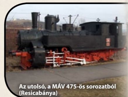
Az utolsó, a MÁV 475-ös sorozatból (Resicabánya)

A bányatelepnek történelmi jelentősége is volt. 1944 év telén a bányavasút különleges feladatot kapott, bár ennek nem volt köze az áruszállításhoz. Amikor Szálasi Ferenc nemzetvezetőnek az országban egyre inkább nyugat felé benyomuló szovjet csapatok elől a fővárosból menekülnie kellett Farkasgyepűn rendeztek be kormányzati központot. Ez volt a Gyepű I. Később ez a térség is veszélyeztetett zóna lett, tovább kellett menekíteni nyugatra. Brennbergbánya lett a Gyepű II. Szálasi 1945. február 2-án egy, az ország észak-nyugati, még német-magyar kézen maradt részében tett országjárásról tért vissza, az időjárás különösen rosszra fordult. Az országúton gépkocsival közlekedni nem lehetett, pedig az már biztosítva volt egymástól látótávolságra felállított csendőrökkel. Az a döntés született, hogy a nemzetvezető feljuttatása érdekében a bányavasutat veszik igénybe. A vasúti szakértők tiltakozása ellenére egy 424 sorozatú mozdony által tolt hómárgépet engedtek a pályára. Végül kíséretével együtt Szálasi és a 424-es is feljutott Brennbergbe, de másnap a vonalbejáró az ívet több helyen 10-15 centiméterrel kinyomva találta. Ugyanebben az évben járt még egy hasonló mozdony a vonalon. A legendás aranyvonatot továbbította, ami a budapesti zsidóságtól elkobzott értékekkel: festményekkel, ékszerekkel, órákkal, nagy értékű szőnyegekkel rakott kocsikból állt. Három hónap tartózkodás után a vonat elhagyta az állomást, új rendeltetési helye Tirol lett.