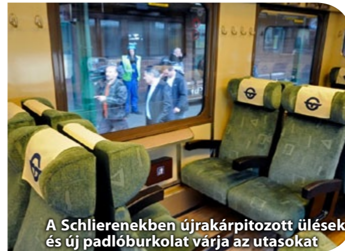
A Schlierenekben újrakárpitozott ülések és új padlóburkolat várja az utasokat

Érdekesség, hogy az utastérbe újságtartókat is szereltet a vasúttársaság.