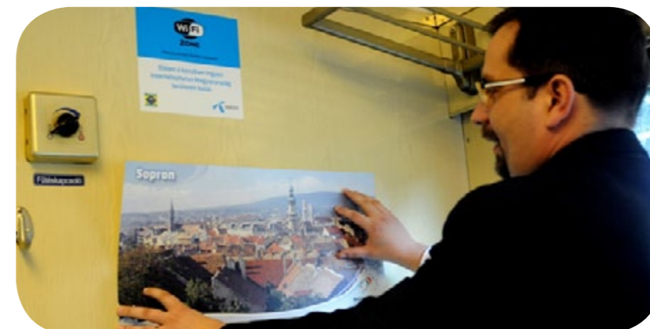
A tájképek a Nyugat-Dunántúl turisztikai értékeire hívják fel a figyelmet