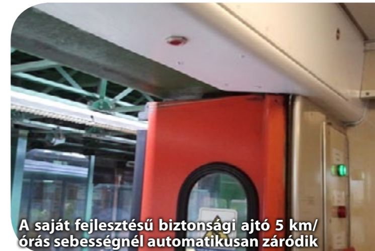
A saját fejlesztésű biztonsági ajtó 5 km/órás sebességnél automatikusan záródik

turista, minél kényelmesebben utazhasson. A vasúti kocsikban is szeretnénk felhívni az utasok figyelmét a sok esetben megújult, felüldülést és pihenést kínáló Nyugat-dunántúli úti célokra. Egy régió turizmusának a sikere több tényezőről, így az együttműködések is múlik: ebben az